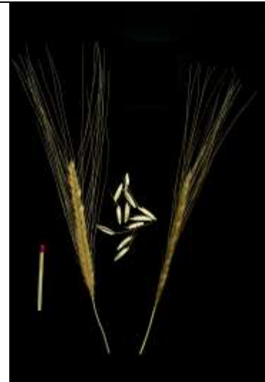
Triticum baeoticum , Wild-Einkorn