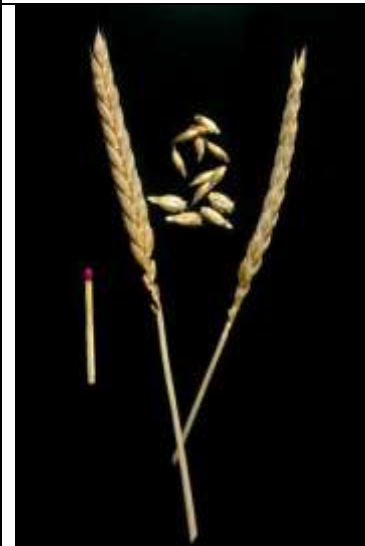
Triticum aestivum ssp. spelta , Dinkel