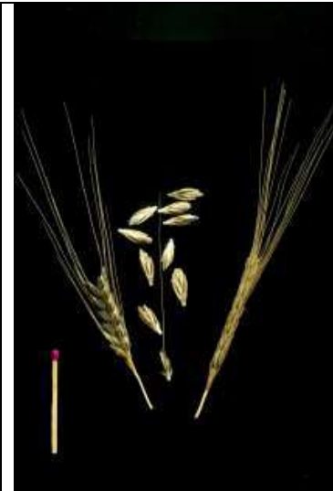
Triticum dicoccoides Wild-Emmer