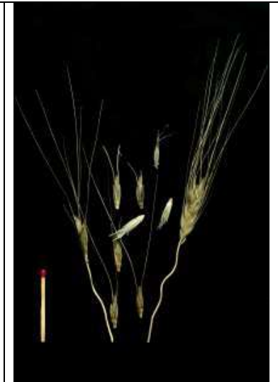
Triticum dicoccoides var. araraticum Wild-Emmer