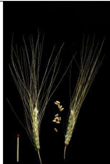
Triticum durum , Hart-Weizen