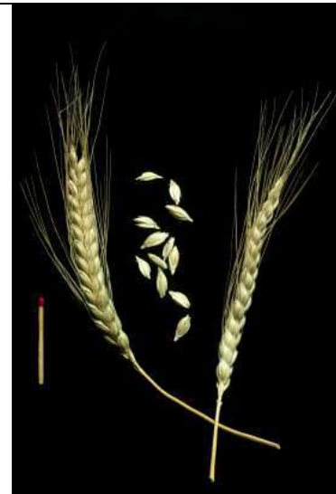
Triticum dicoccon Kultur-Emmer