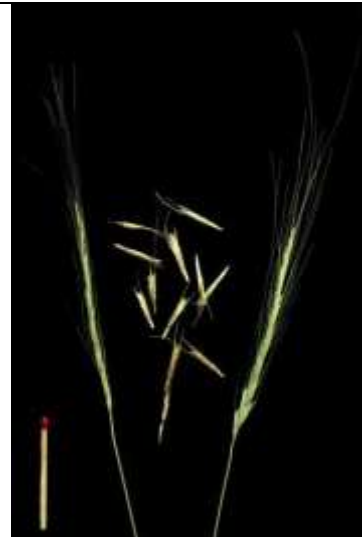
Aegilops speltoides ( Triticum searsii ) Dinkelähnlicher Walch