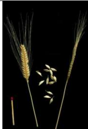
Triticum monococcum , Kultur-Einkorn