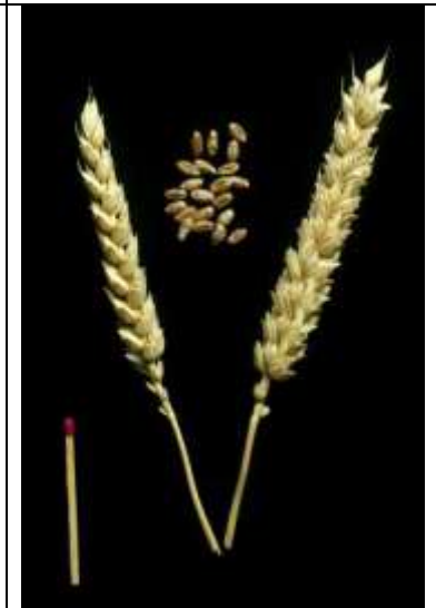
Triticum aestivum , Kultur-Weizen